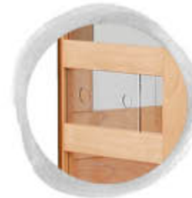
Versorgungsöffnung (Loch) mit Verschlussmechanismus

Unsere Schlauchdurchführung/Versorgungsöffnung ist in folgenden Ausführungen erhältlich: