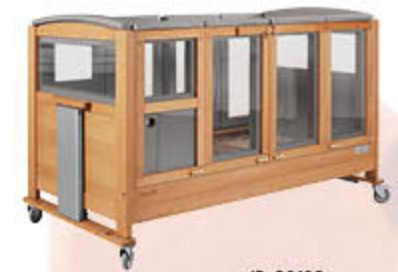
ID: 36496 Versorgungsöffnung (Loch) mit Verschlussmechanismus