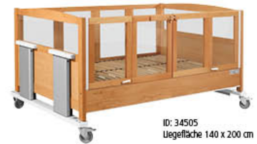
ID: 34505 Liegefläche 140 x 200 cm