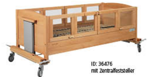
ID: 36476 mit Zentralfeststeller