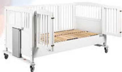
ID: 32973 Weiß lackiert