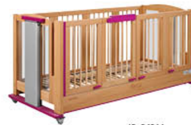
ID: 34214 Schlauchdurchführung (Spalt)