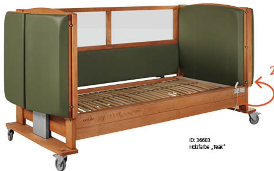
ID: 36603 Holzfarbe „Teak“