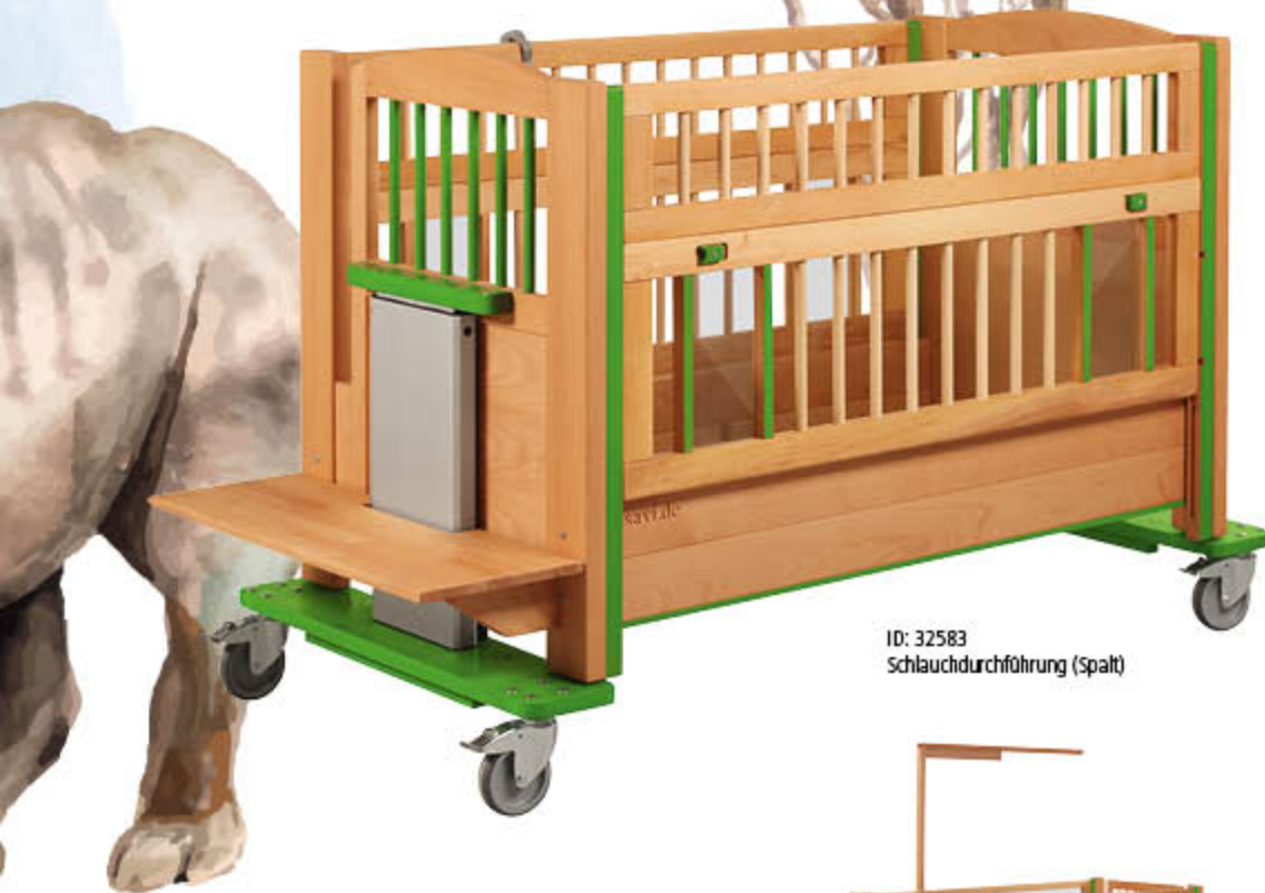
ID: 32583 Schlauchdurchführung (Spalt)