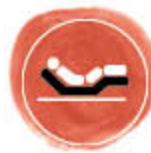
Kopf- / Fußelement manuell verstellbar oder optional elektrisch verstellbar

Neugierig wie Knut (a) (100 x 200 cm, Seitengitterhöhe 64 cm) in Ihrem Kinderzimmer aussieht?