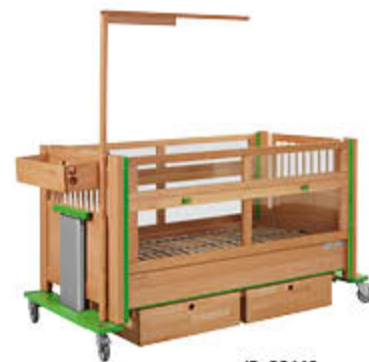
ID: 38446 Ablagefach mit Schlauchdurchführung zum Einhängen