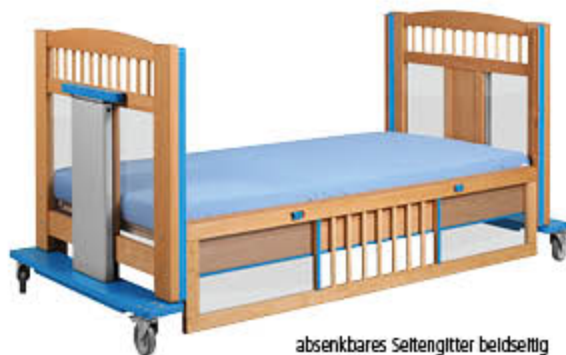
absenkbares Seitengitter beidseitig (optional)