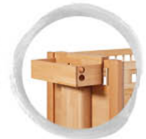
Ablagefach mit Schlauchdurchführung zum Einhängen