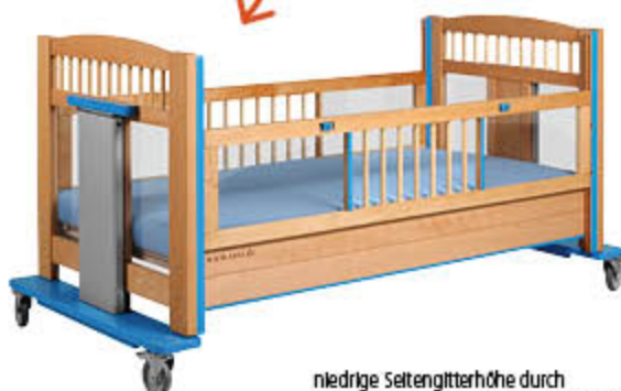
niedrige Seitengitterhöhe durch entfernbares Aufsteckelement beidseitig (optional)