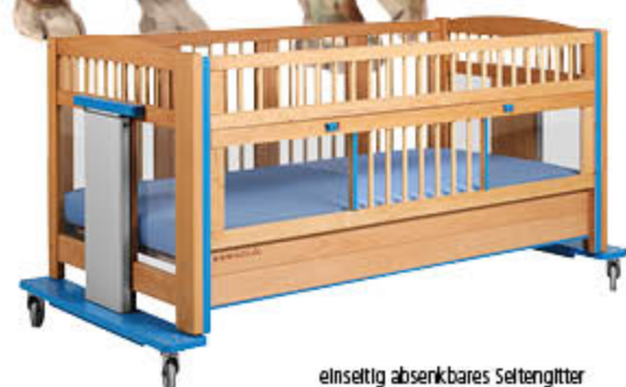
einseitig absenkbares Seitengitter mit 24 cm Aufsteckelement (serienmäßig)