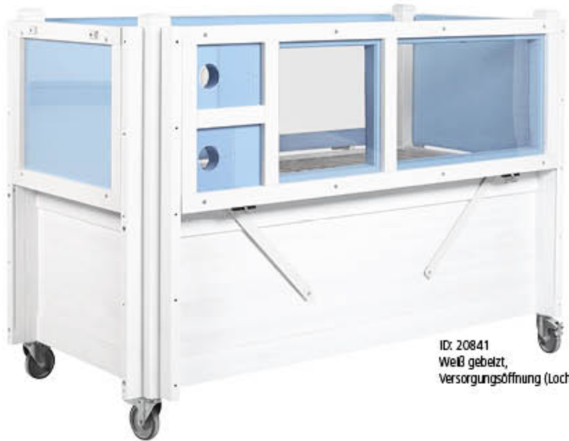
ID: 20841 Weiß gebelzt, Versorgungsöffnung (Loch)