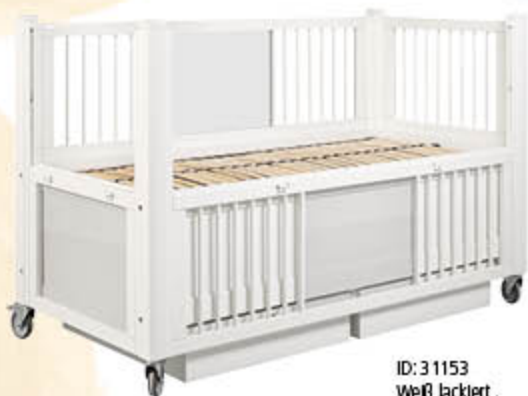
ID: 31153 Weiß lackiert, zwei Schubkästen, teils Lexan, teils Stäbe