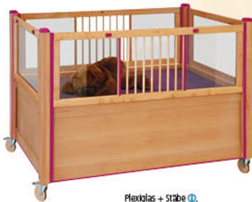
Plexiglas + Stäbe ☺, z. B. mit absenkbarem Seitengitter, Im Farbakzent Purpur