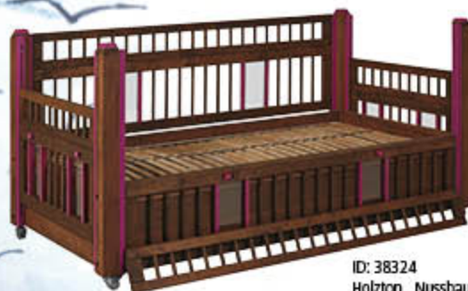
ID: 38324 Holzton „Nussbaum“