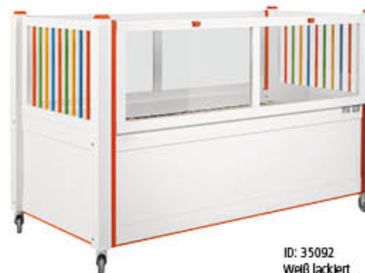
ID: 35092 Weiß lackiert