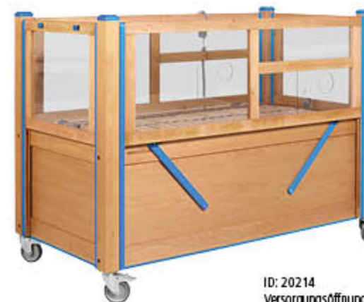
ID: 20214 Versorgungsöffnung (Loch) mit Verschlussmechanismus