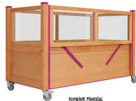
Komplett Plexiglas, z. B. mit elektrisch absenkbarem Längsseitengitter, Im Farbakzent Purpur