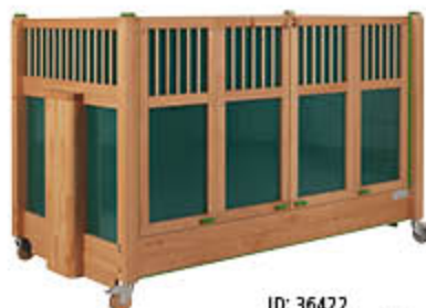
ID: 36422 Kindemame auf der Bettseite, feste Polsterung (Material: LKW-Plane)