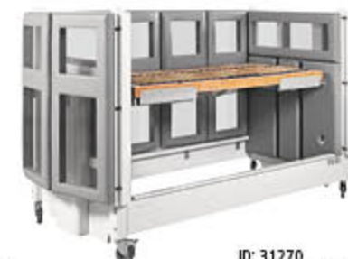
ID: 31270 Weiß lackiert (deckend)