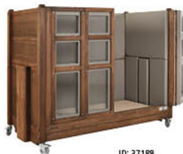
ID: 37188 Trittschutz für den Lattenrahmen, Holzton „Nussbaum“