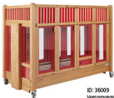
ID: 36009 Versorgungsöffnung (Loch) mit Verschleißmechanismus

Die integrierten Vinylfenster fügen sich flächenbündig in die feste Skai-Polsterung ein und bieten somit eine ähnliche Polsterwirkung wie die fest integrierte Schaumstoffpolsterung. Die Fenster bieten den optimalen Durchblick. So haben Sie Ihr Kind besser im Auge und Ihr Kind fühlt sich sichtlich wohler.