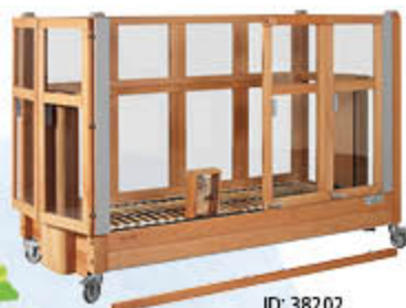
ID: 38202 Farbkent Grau, abschließbare Handschalter-Box, externe Verriegelung