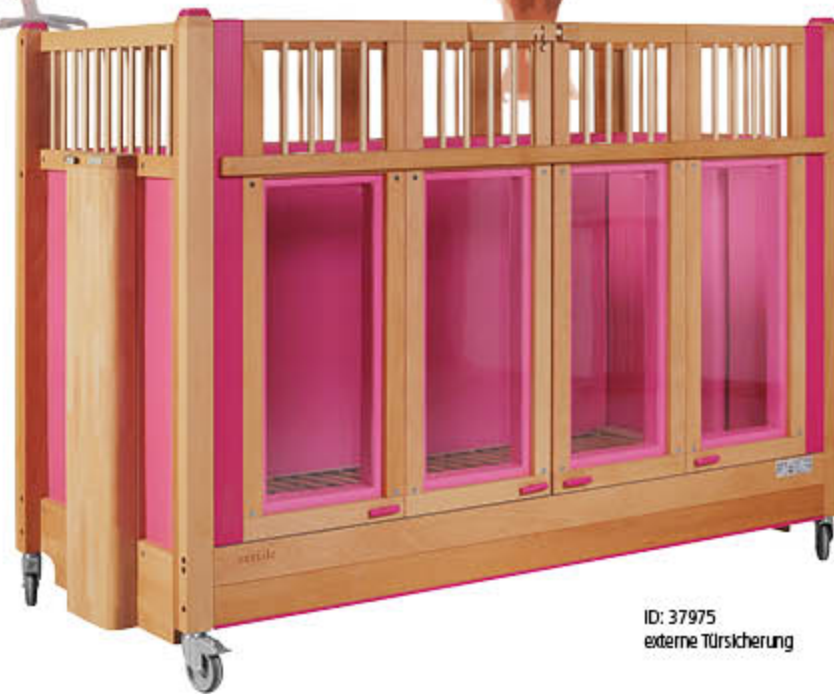
ID: 37975 externe Türsicherung

Scannen Sie den QR-Code und erfahren mehr über unsere feste Skai-Polsterung mit Vinyl-Fenstern und deren Polsterfähigkeit.