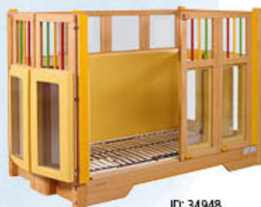
ID: 34948 ohne Rollen, bunte Stäbe