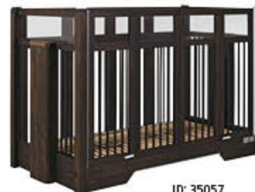
ID: 35057 niedriger Einstieg (ohne Rollen), Holzton „Basalt“