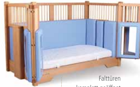
Falttüren komplett geöffnet